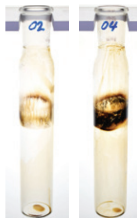
TRAXON SYNTHETIC MTF 75W-80 КОНКУРЕНТ А, СИНТЕТИЧЕСКОЕ МАСЛО, 75W-80

В испытании DKA на окисления эффективность продукта оценивалась путем измерения повышения вязкости масла в течение определенного времени (чем ниже столбик после 192 часов, тем лучше). По сравнению с двумя ведущими конкурентами продвинутой состав масла TRAXON Synthetic MTF 75W-80 лучше препятствует разложению и загустеванию масла.